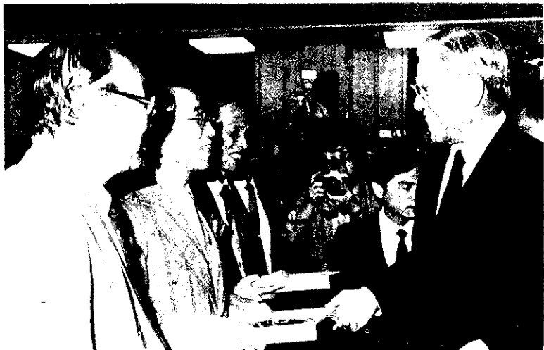
副總統李登輝在中華民國環境綠化協會會員大會中頒獎表揚績優人員及單位。

李副總統最後強調，台灣農業過去幾乎單純屬於生產層面，為了達到維護環境效果，今後應以環境生態為導向。