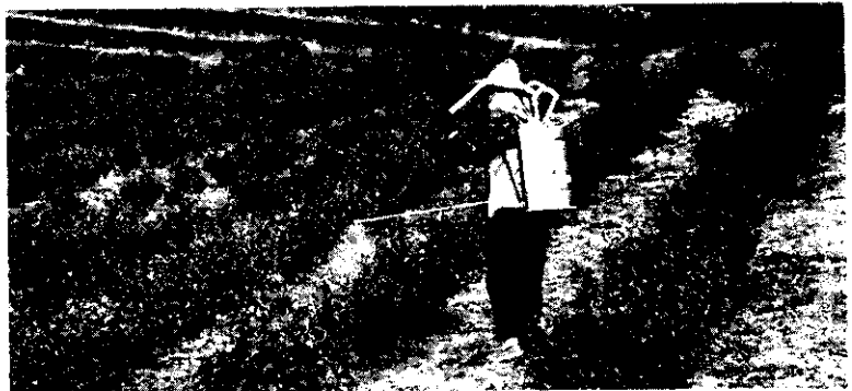
噴洒農藥要小心！

2. 增訂水懸劑、糊狀劑、油劑、袋劑、套袋、霧劑、夏油、軟膏劑和水分散性粒劑等的劑型規格，其中夏油的劑型