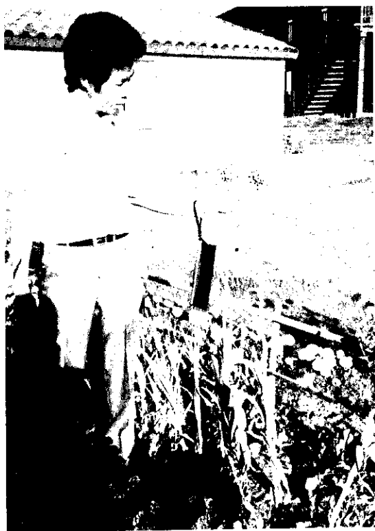
巨頭大蒜的花梗和開紫色花的花球。