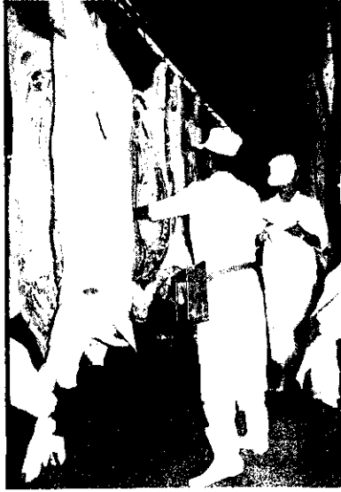
屠體分級，提高肉品品質。

配合此項作業的開辦，台北市市場管理處與台灣省政府農林廳，將於75年12月24日至76年1月2日，在台北市羅斯福路一段仰德大樓，舉辦肉品運銷與衛生展覽及品嚐會，歡迎農友踴躍參觀。