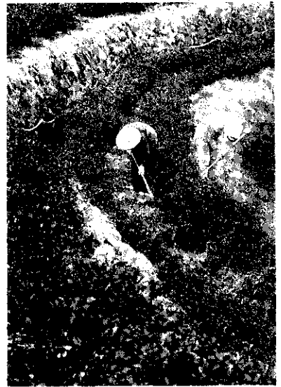
農友們可把自己的耕作經驗寫成文章，投寄給「推廣簡訊」發表。

同時也非常希望各級農業推廣或農業行政人員，將平日工作心得、訪問成功農友經驗所得、農友經驗發表會的素材，以及農村所見所聞所感或建議，整理為簡短的文章，投寄給這八場一所的「推廣簡訊」