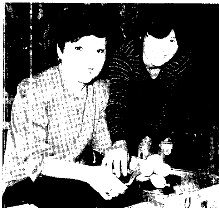
分級包裝要做好