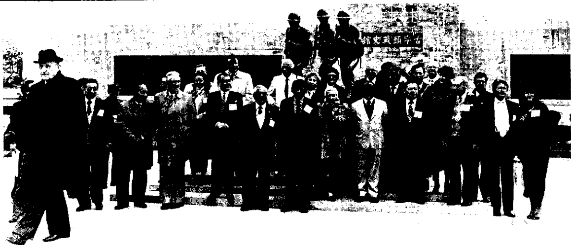
來華參加76年世界自由日運動周活動的各國反共領袖，訪問金門並在古寧頭戰史館前合影。