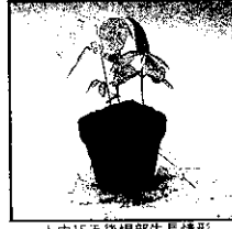
育苗杯盆與一般栽種的比較