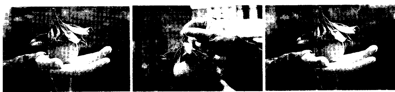
海梨柑帶枝葉採收，會引起失重，影響來年結果，而且分級包裝不便。