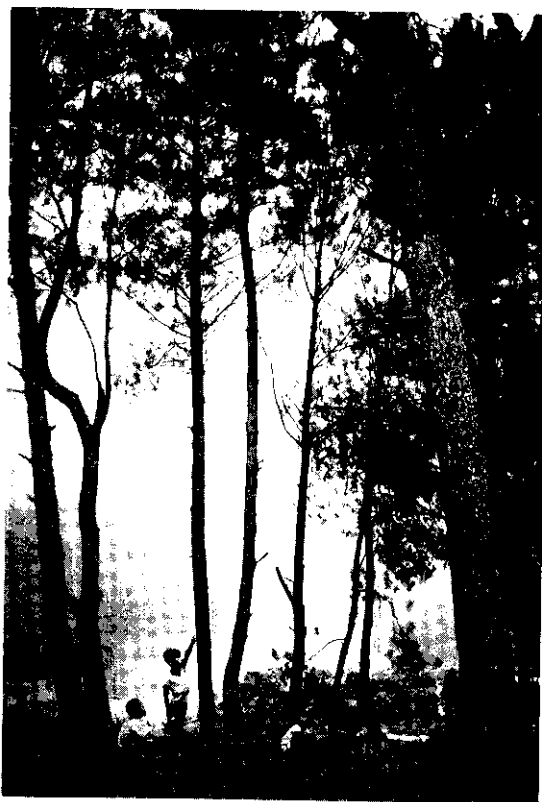
林間嬉戲

林務局為因應國民的此種需求，自早期起即已規畫設立大型森林遊樂區如阿里山、墾丁、太平山、合歡山；小型森林遊樂區如烏來、武陵、田中、藤枝、