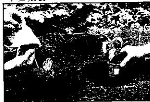
育苗杯盆與一般栽種的比較