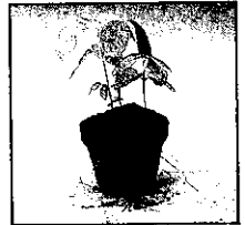
土中15天後根部生長情形