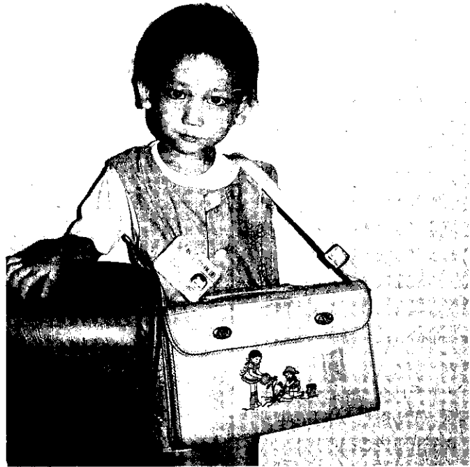
為孩子選擇一個好學校

不論混合型或順序型的藥丸，真正的避孕藥丸是21粒。近來的避孕藥，常常是28粒裝，多出的7粒