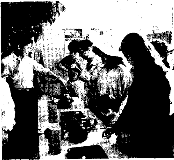
好茶大家來品嚐（阿草）