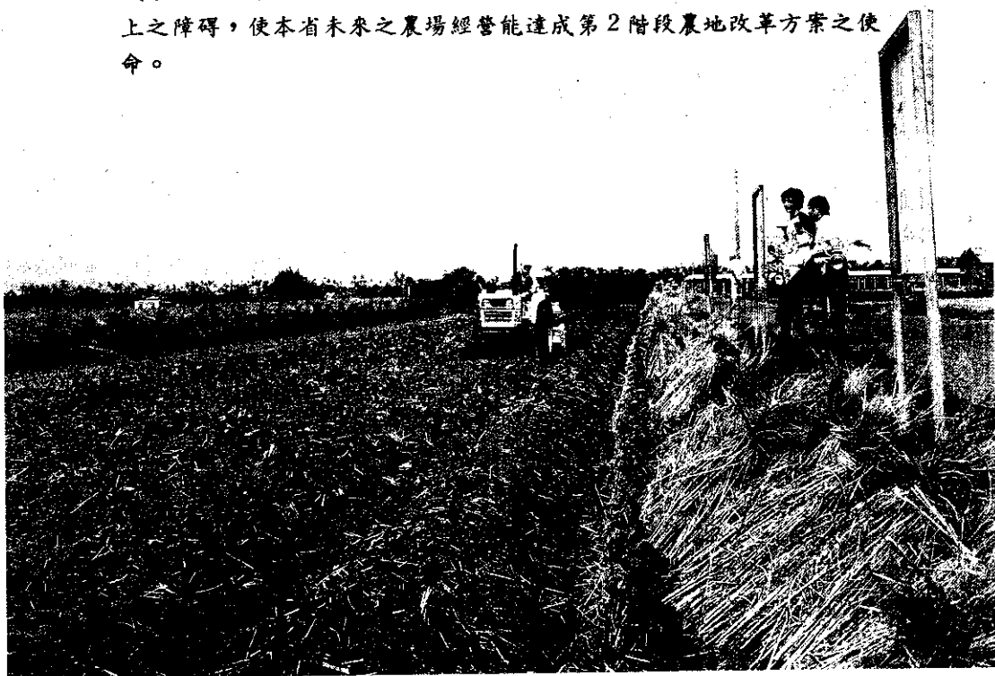
委託經營進行大面積委託作業

台中縣大雅鄉農會台中縣大雅鄉農會嘗試採用迂迴方式來推行農業共同及委託經營；農會運用基層農民生產組織，使耕地經營權能有效集中而不必強求所有權的歸併，這樣才能擴大規模，降低農業生產成本，提高單位勞動力的報酬，改善農民的生活，同時消除農民心理上之障礙，使本省未來之農場經營能達成第2階段農地改革方案之使命。