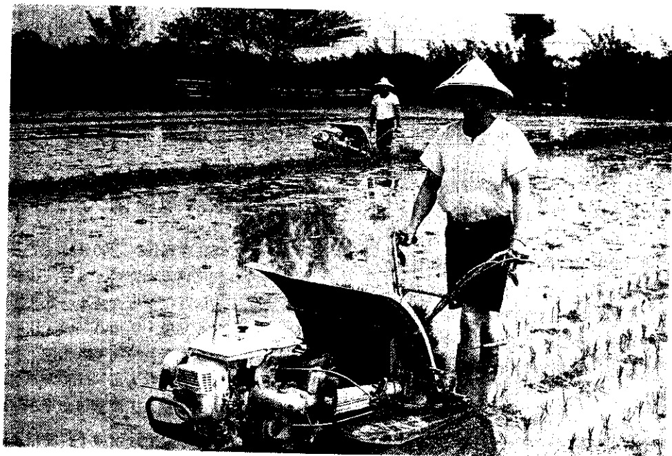
核心農戶進行農機更新及代耕服務

大雅鄉屬於近都市型之農業鄉村，鄉內及鄰近工商業發達，到處工廠林立，一般小農轉業方便，委託代耕及委託經營在該鄉實質上已進入相當普遍階段，然而大部份的農民，由於受到「第1階段農地改革」、「三七五減租」、「耕者有其田」條例之影響，深怕委託出去的土地為受託人所有或被征收，雖然政府已經針對農民的疑慮修正了農業發展條例，以祛除委託人的心理障礙，但幾年來辦理的成果仍不理想，為突破此種瓶頸，於是該鄉農會改採迂迴方式，由農會出面受託接受一般農戶之委託申請，然後農會再依照地緣、鄰落及灌排水系統之實際情形，再委託信譽較佳、組織健全、農機配備充足及田間作業管理技術良好之共同經營班來執行代營，使農會成為推行共同及委託經營之中心，早日達成地盡其利、地利共享、擴大農場經營規模之目標。