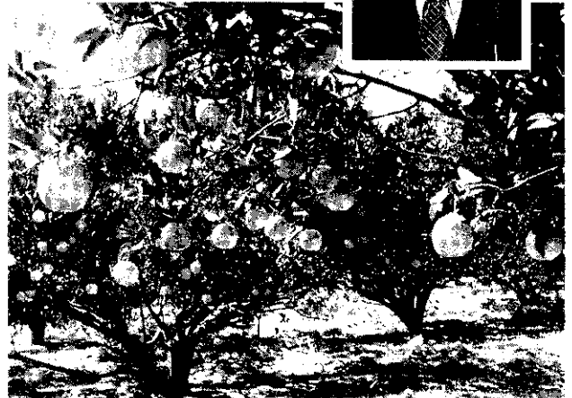
不斷改善栽培技術，才能提升品質。

林農友對於椪柑、柳橙、葡萄柚之儲藏，採用通風良好而陰涼的倉庫，在果實入庫前先浸泡霉敵殺菌，這樣不但能延長儲存的時間，而且腐損率也降低至最低（1.5%），既能配合市場需求，又能減少損失，果農增加很多的收益。