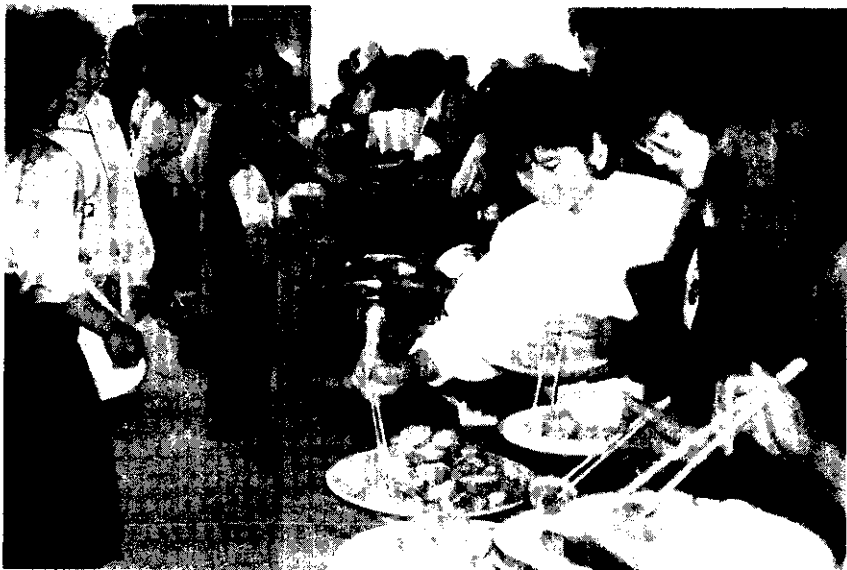
雲林縣農會農業推廣教育中心大樓舉行落成典禮，以米食等款待與會嘉賓。