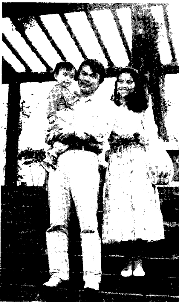
夫妻互相信任，家庭幸福美滿