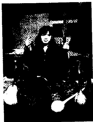
封面：扁蒲形形色色