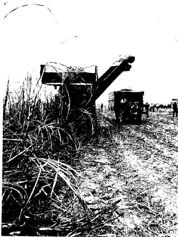
蔗葉燃燒固然有利採收，但蔗灰迷漫是否該改進？