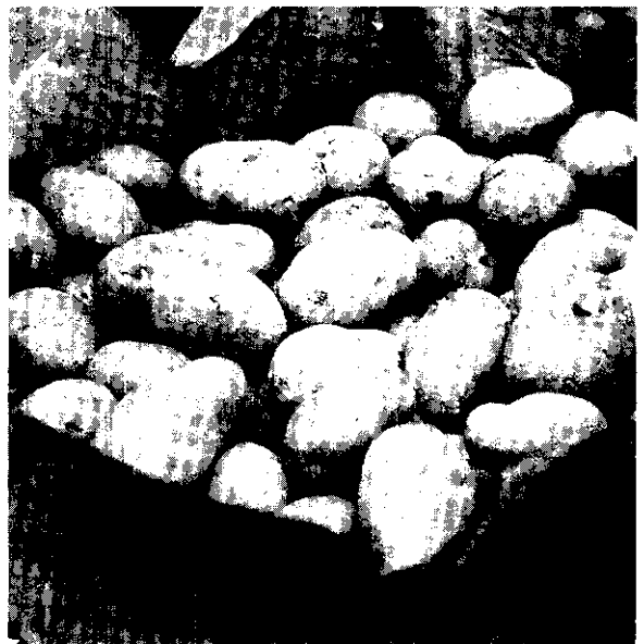
馬鈴薯為本省主要雜糧作物之一。(阿郎)

栽培方法除整地作畦採用機械操作外，大部份需依靠人工作業，尤其收穫時費工最多，市面尚無良好收穫機械出售，目前農民自創一種三個小犁頭掛於耕耘機上代替人工挖薯的簡單機械，工作效率雖然比人工用小鋤頭挖薯快，尚須由人工拔株，因此挖薯費工很多。嘉義農業試驗分所為解決馬鈴薯收穫問題，利用該分所研究成功之甘薯收穫機代替收穫馬鈴薯，經過多次試驗改良結果，均能適合採收馬鈴薯之用。