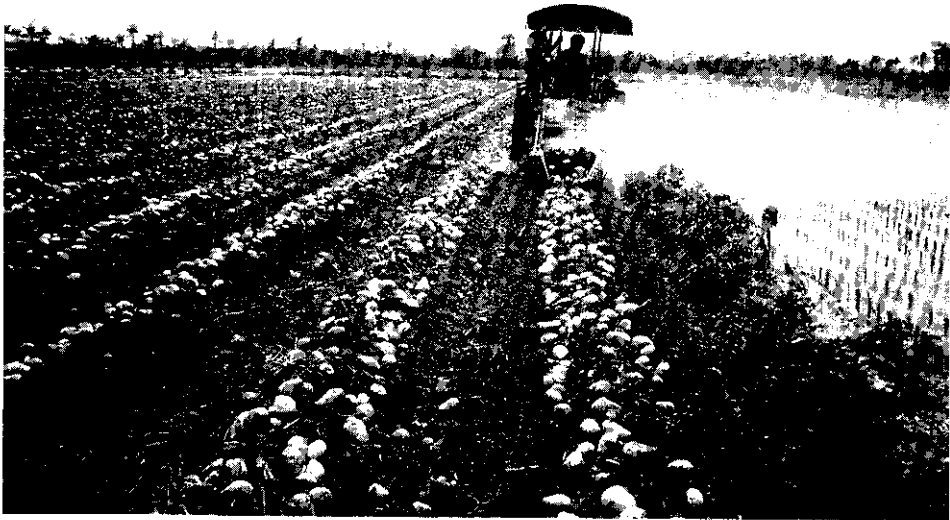
甘薯收穫機田間採收馬鈴薯情形

馬鈴薯為本省主要雜糧作物之一，不但其產品供本省內銷，而且外銷。近年來由於外銷良好，栽培面積日益擴大，尤其利用冬季裏作栽培，增加農友收益，因此將有擴大推廣的希望。