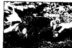
育苗杯與一般栽種的比較