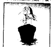
15天後根際生長情形