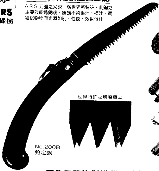
世界特許之研磨自立

ARS 刀鋸之尖銳，為世界所特許，此鋸之主要效能為鋸後，鋸齒不染果汁、橙汁，而被鋸物表面光滑如削，性能、效果俱佳。