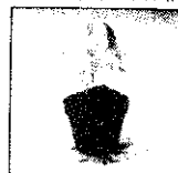
育苗杯裝滿土，將種子播入育苗杯中。