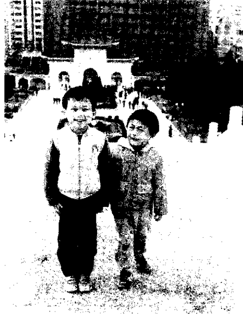
二個孩子恰恰好

女性懷孕之後，月經會自動停止。懷孕4個月左右，腹部才會微微隆起，從側面便可以明顯地看出突出的腹部，孕婦也可以感覺腹中的胎動。