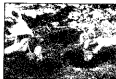
育苗杯裝滿土後，即可將種子播入。