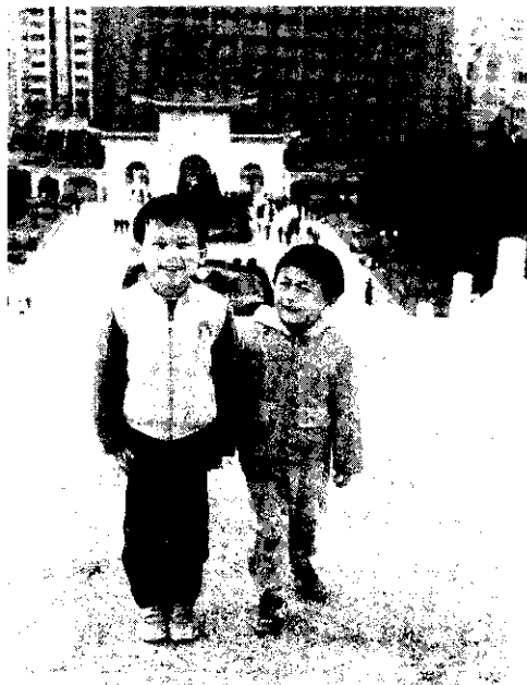
二個孩子恰恰好

女性懷孕之後，月經會自動停止。懷孕4個月左右，腹部才會微微隆起，從側面便可以明顯地看出突出的腹部，孕婦也可以感覺腹中的胎動。