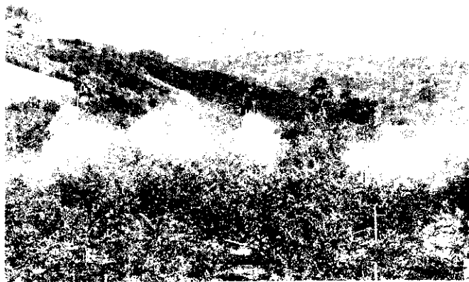
坡地果園管路自動噴藥情形

機由於高風速與大風量，噴出的藥液呈霧化狀，可飄送到果樹枝葉上，而進行全面整體的防治。又由於藥液粒子微小，可提高藥液濃度，減少用水量。