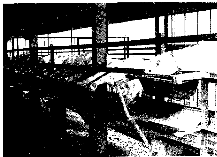
高腳羊舍，不但可以保持舍內乾燥，而且羊糞自動滑落地上，踏腳條板也能維持乾淨。

則，應把此項飼料當作補充水分，如果給飼過量，會使羊乳風味降低，且乳羊容易老化。另外，他也特別注重飼料的配方，以提高羊乳的品質與風味，適合消費者的口味。他在精飼料中添加豆粉，可以增加泌乳量；加若干花生餅，更能增進風味及泌乳。