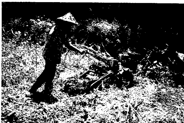
生薑動力挖掘機採用 8 馬力柴油引擎為動力

數)。又輸送柵鏈上的驅動皮帶輪不能選用直徑50公厘以下，否則皮帶輪之接觸角不夠，容易打滑造成阻塞。由於將輸送柵鏈主驅動皮帶輪直徑加大至15公分，故其輸送柵鏈的速度比較快些。