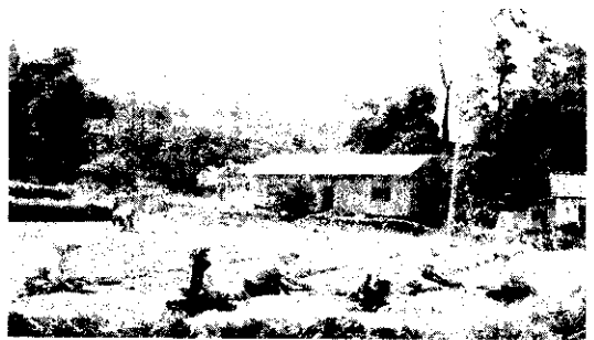
高冷地種蒜頭

答 (1)大蒜葉尖及下葉黃化的原因為，(D)種蒜成熟度不夠或未曬乾。(2)遭遇高溫多濕。(3)日照不充足。(4)土壤酸性及病虫害（如黑斑病、軟腐病、薊