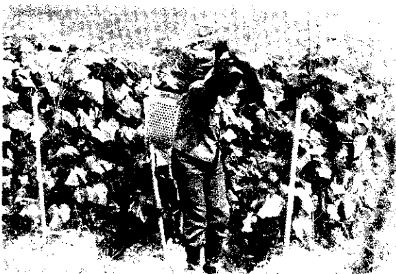
胡瓜採收