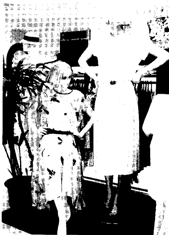
買新衣要精打細算

家裏裝飾得豪華氣派，而沒有考慮預算或生活費的有無，購買許多裝飾品之類，若房間的空間有限，則因東西過多顯得離亂。另一方面也使家庭預算透支，所得到的却是反效果，這就是浪費。所以先斟酌自己的家庭經濟能力，購買家庭的必需品與裝飾品。總之，事物有輕重緩急，開支須有明辨的智慧，對於「當用