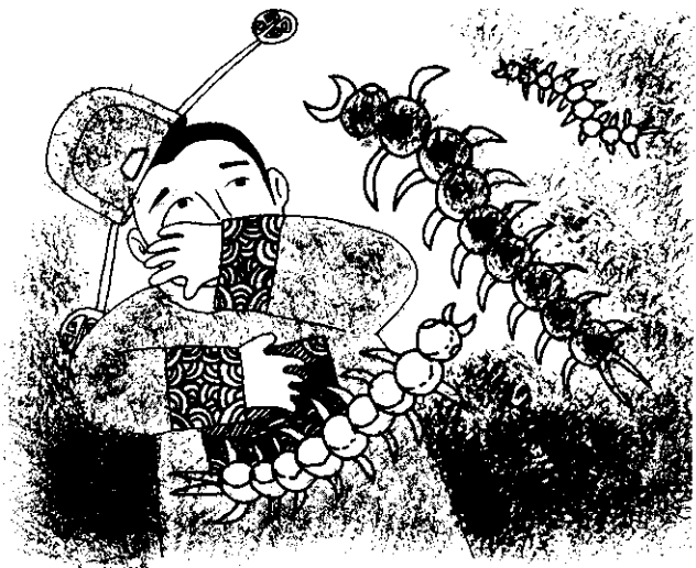
蜈蚣在屋內飛來飛去，使貪官驚慌失措。