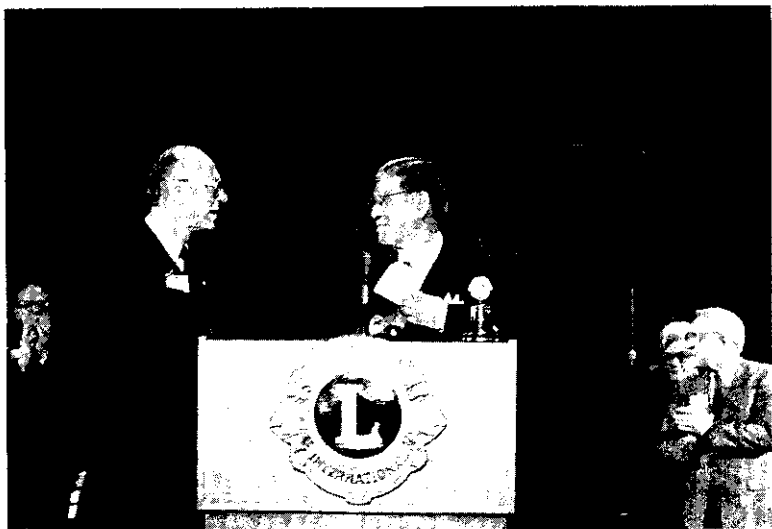
國際獅子會第70屆世界年會開幕典禮，7月1日在林口中正體育館舉行，副總統李登輝親臨致詞。

農林廳表示，省府為鼓勵各縣市政府全力推行「台灣省加速農業升級重要措施」，發展精緻農業，以達成農業生產科學化，農產品質高級化，農業結構縱深化，提高農民所得，增進農民福利，特訂定推行精緻農業成果評審小組。嘉義縣經評審結果成績優良，且具有代表性，所以這次成果觀摩及品嚐會在該縣舉行，以資示範。