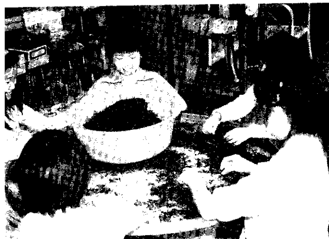
大家一起來檢茶菁