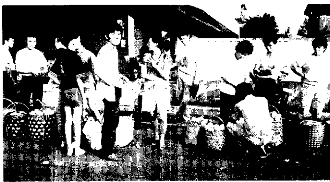
八里鄉農會前，綠竹筍交易熱絡情形。(林正松)

竹筍富有纖維質，沒有膽固醇，又可幫助消化，清淡可口，風味絕佳，既可為主菜又可以為配料，煎煮炒炸、悶醃燉烤外，還葷素相宜。