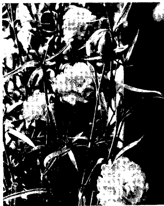
康乃馨是插花的好材料(阿丰)