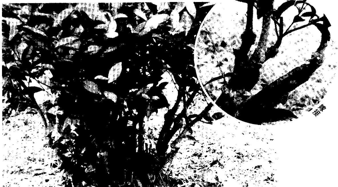
嫁接後生長良好之茶樹

大湖鄉農會為配合政府發展精緻農業，開闢農業觀光資源，提供國民旅遊活動場地，特將該鄉經營的農園，朝向多元化之層次發展。