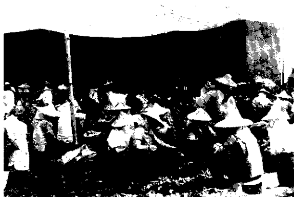
圖1 利用人工進行脫莢工作

毛豆莢每公頃之收穫量約為6,000公斤，而毛豆之脫莢作業目前仍依靠人力，如照片1所示。脫莢工資為每公斤3~4元，總工資為9,000萬~1億2,000萬元，因而在目前農村勞力缺乏及提高毛豆莢外銷之競爭能力情況下，其脫莢作業急需利用機械代替人力之必要。