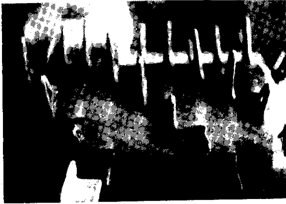
圖 3 脫莢筒之構造