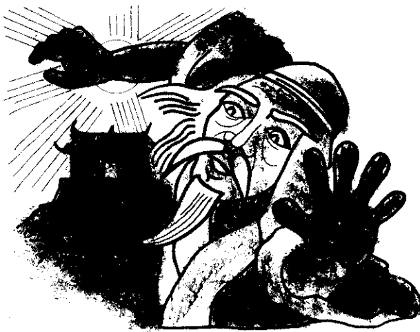
老道士回頭一望，見文廟上空寶光四射，有如白晝。

，反轉三次，然後在廟門兩旁攔了兩支掃帚，並在石階上平放一個簸箕。廟內的讀書聲立即變成掃帚打掃火硝的掃地聲，道士以為風脈已破，拂髯仰