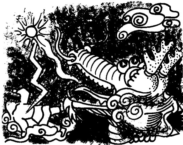
龍王吐出一顆寶珠，一道閃電後，寶珠將老道士擊倒。