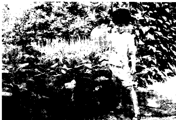
健康的小朋友

因此，發燒體溫不正常時，不可隨便吃退燒藥，以免把「熱型」的特徵弄亂了，影響醫師正常診斷。 (沈奇文)