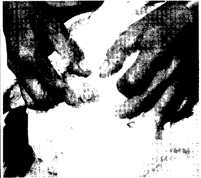
公母鑑別：左為公鴨，右為母鴨。