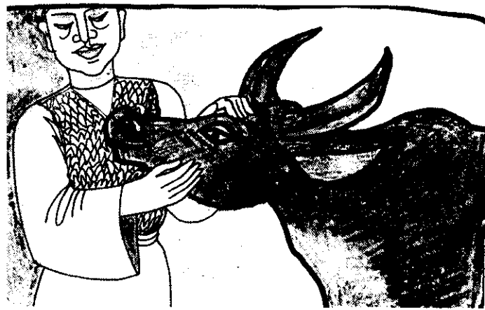
十二月十二日清早，老牛第一個趕到崑崙山，值日功曹見了誇獎地道：「老牛，辛苦了，第一頭入場證發給你。」

「像你我這樣弱者，應徵有希望嗎？告訴你，龍和虎都要去呢，你我怎能和牠們競爭？」老鼠質疑的說。