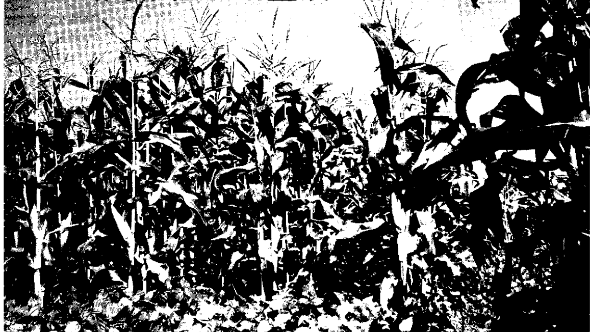
株株玉米長得亭亭玉立，討人喜歡