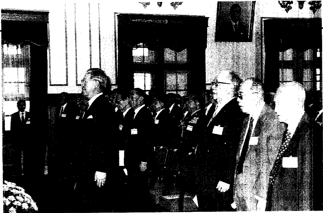
中樞紀念孔子誕辰典禮，9月28日在總統府大禮堂舉行，副總統李登輝代表總統主持。

試辦中的第一期農保，目前保險費率為5.8%，投保金額6,900元。由於費率及投保金額偏低，而醫療支出偏高，截至本年6月底止，已虧損6億7千2百餘萬元。