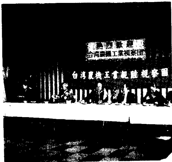
觀摩有助於兩國業者之技術交流以及擴展交易，兩獲其利。(莊石鑑)

答：適當的設計約可減10%，良好的搬運方法可節省下人工搬運費約15%，快速供貨方面也降5%的運送及時救損失。