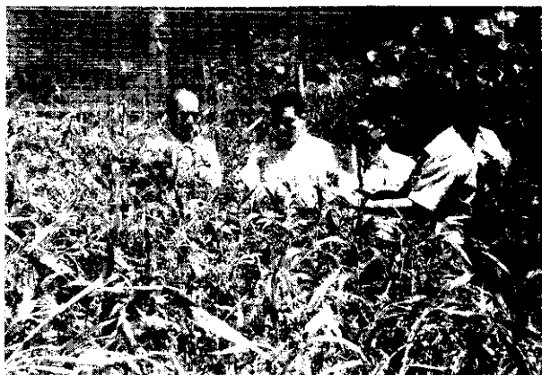
嘉義縣吳鳳鄉種植薏仁情形(阿郎)

之氨基酸、維生素、8-octadecenoic等可促進新陳代謝，對皮膚粗糙、魚鱗痣及其他贅疣等具有保養及消除作用。