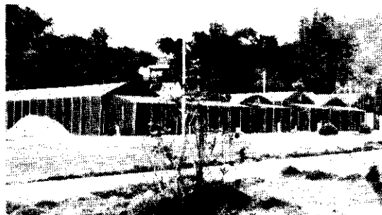
(台灣省農業試驗所菇類研究室)