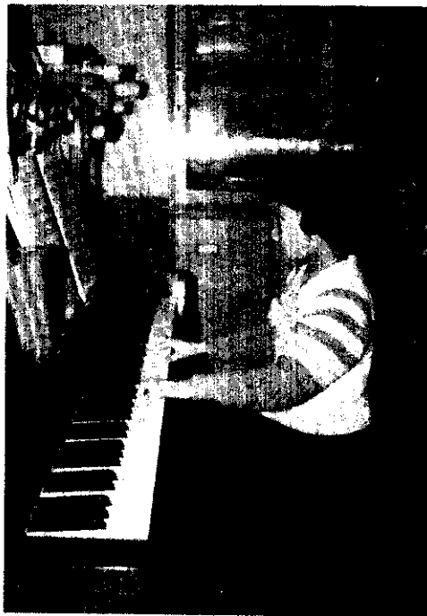
學琴的孩子不會變壞

(五)大人應該以身作則：這個原則，在任何事情上都可以應用。假使做父母的日夜都忙着做自己的事情，那當然沒法誘導或刺激孩子們的創造力。相反地，如果你們在家