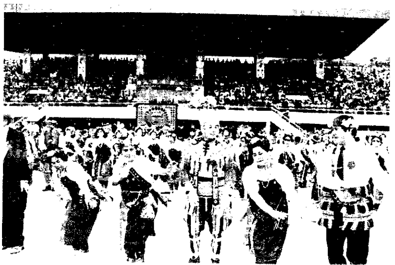
台東縣慶祝設治100周年，11月8日舉行山胞民俗文化才藝舞蹈比賽，縣長鄭烈(右3)與山胞們共舞。

農林廳預定自76年12月起至77年6月底止，動支經費 300餘萬元，在全省辦理這項疫苗注射工作，預期完成新種母豬日本腦炎預防注射47,650頭，約可減少仔豬損失23,750頭，減少農民損失約11,875,000元，且以此示範預防注射教育農民，使農民認識防治本病的重要性，進而達成農民自動防衛豬傳染病的目的。