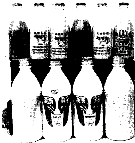
建立品牌行銷全省

22戶，飼養乳牛661頭，日產生乳約5公噸由養樂多公司收購。乳廠設立後，外埔鄉、后里鄉及大肚鄉推廣新酪農戶擴大經營規模，目前輔導3鄉酪農45戶，飼養乳牛1,402頭，每日收購乳量約達9公噸，除部分交由養樂多公司加工外，其餘由乳品加工廠加工製造漢濱牌乳品，每日約生產8公噸產品，供應市場需要。