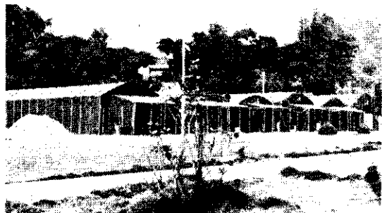
(台灣省農業試驗所菇類研究室)