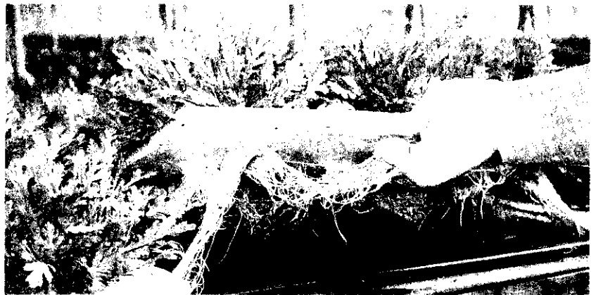
↓ 利用N.F.T水耕栽培的苺蒿根部生長情形