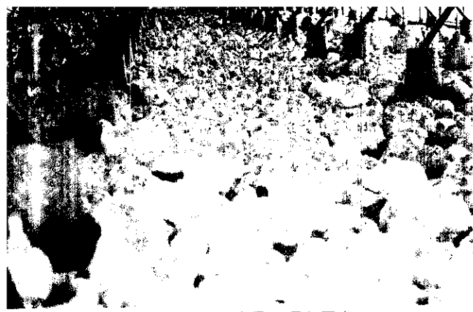
雞群飼養過密是互啄主因之一。